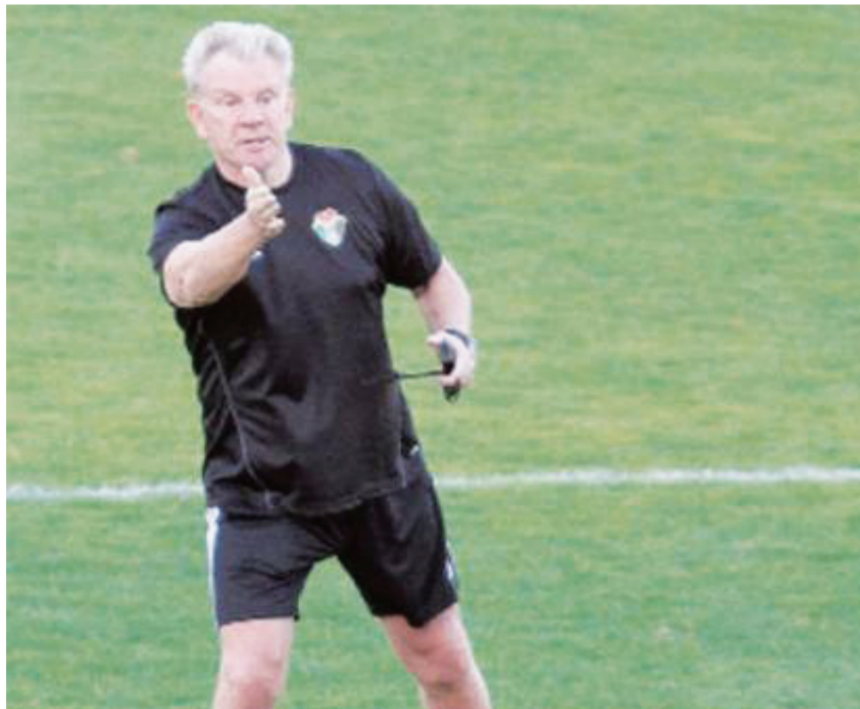
بول بوت .. وقيادة ناجحة للمنتخب

صدم مدرب أستراليا وبدأ الشك يتسلل إلى نفسه ! بوت أقنع الجماهير واكتسب الثقة المقنعة بالأداء والنتيجة ، وأصبح المنتخب بالمركز الأول برصيد ١٠ نقاط متفوقاً على أستراليا التي حلت في المركز الثاني بفارق نقطة وحيدة .