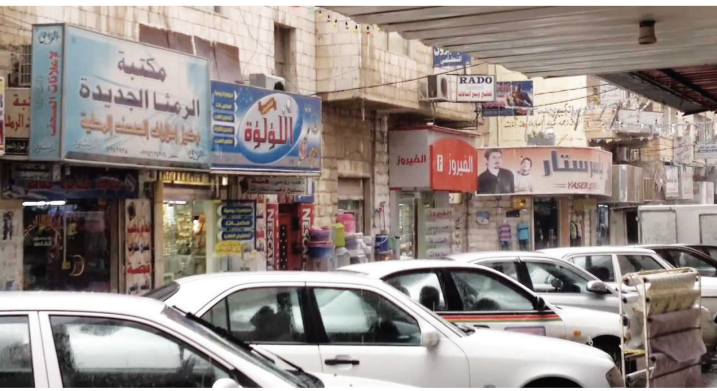
مجلات تجارية في الرمثا

وبيّن أن القطاع المائي في اللواء شهد حركة واسعة وكبيرة نظراً لزيادة استخادم المياه من قبل العبد الكبير من اللاجئين، مما شكل تحديا كبيرا أمام كافة القطاعات المعنية للحيلولة دون تدني مستوى هذه الخدمات. وأشار القاضي إلى أنه وفي صلب هذه التحديات فإننا نتطلع إلى أن يكون هناك دور كبير للمنظمات التي تعنى بشؤون اللاجئين بتقديم المساعدات المالية والعينية لتخفيف الضغوطات علينا.