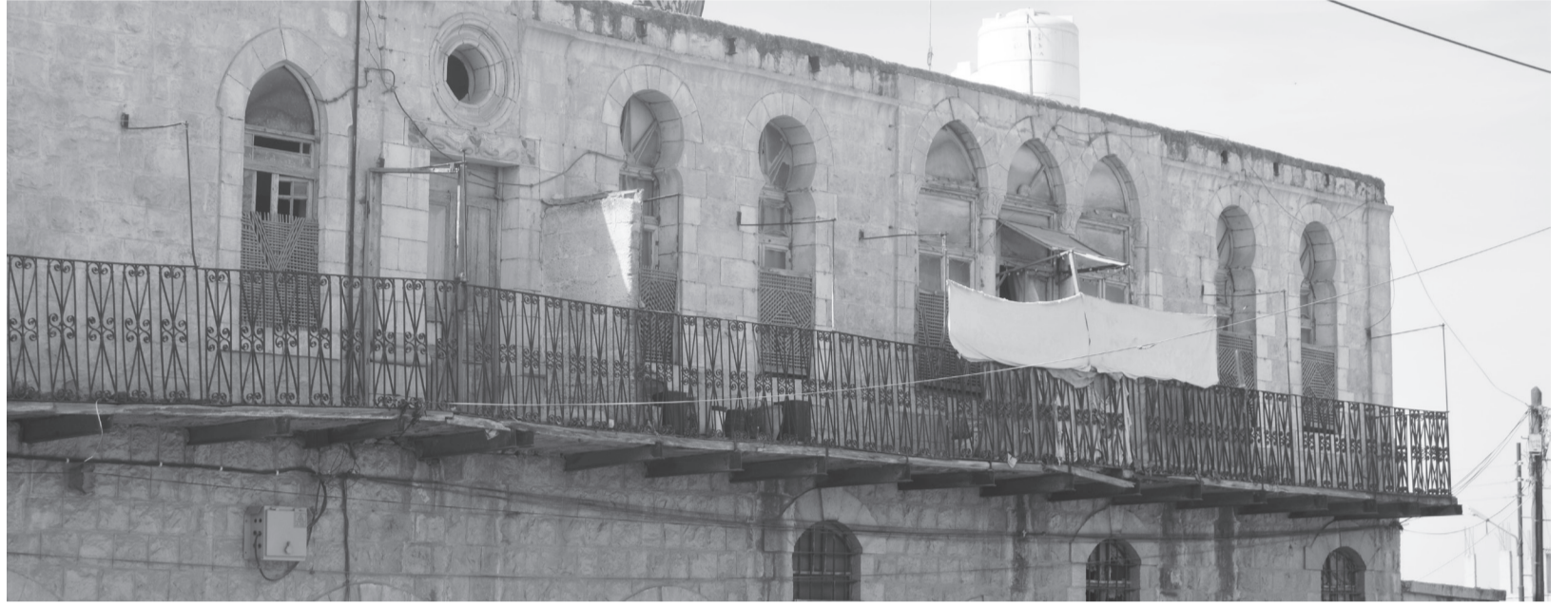
منظر عام لـ «حوش الجودة»

إربد أو «ارايلا» كما شاء الإغريق تسميتها ، تُعد واحدة من أعرق المدن الأردنية على الإطلاق إن لم تكن في بلاد الشام عامة ، والتي وعلى مر العصور الغابرة والأزمنة ، كانت منطقة نشوء حضارات متعاقبة لا تزال شواهدا الصماء تنطق في أرجاء المدينة بعبق تاريخي استحال على ذاكرة الزمان نسيانه ، مهد عرار و فالح كرزيم و كليب الشريدية و غيرهم من الشخصيات التي كان لها دور مفصلي في حالة النهوض الحضاري والثقافي للمدينة ، تلك الحضارة الفذة التي استمرت العيش في غياها أزقتها و حوارها بل وتشتعت في نفوس قاطنيها ، فكانت الكرامة والعزة أينما حل أهلها .. في هذه الزاوية تسلط الضوء على تاريخ المدينة عبر أحيائها وشوارعها .