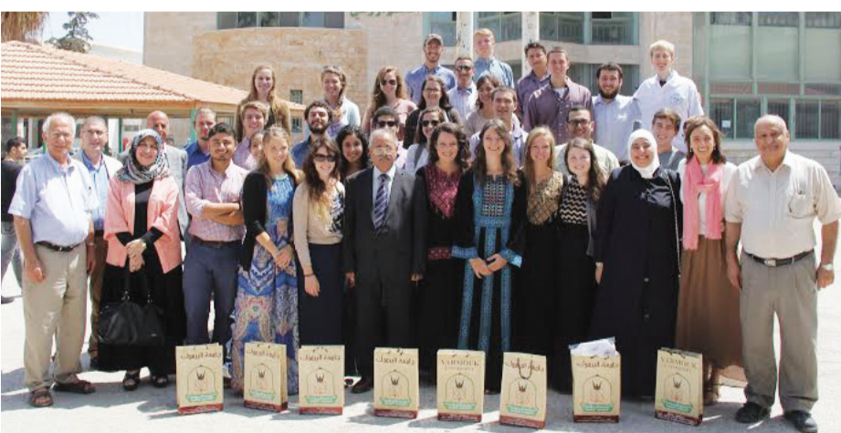
صورة أرشيفية لعدد من الطلبة الاجانب في الجامعة

لايصال الأفكار والمعاني للطلبة بكافة الوسائل كعمل تعشلية بسيطة يشتركون بها، والتي تعمل على تعزيز ثقتهم بتفهمهم وتختير مدى تمكنهم من اللغة العربية. وتشير عبيدات إلى أنه في حال تأخر بعض الطلبة عن استيعاب الدروس أو تأخرهم في التسجيل في مركز اللغات، يقوم الأساتذة بإعطائهم دورات إضافية لتعزيز المهارات التي لم يتمكنوا منها. وأعرب أستاذ الشريعة في الجامعة الدكتور ابراهيم الخالدي ، عن مدى حرصه في التأكد من استيعاب جميع الطلبة لكامل الشرح قدر الإمكان عن طريق تقديم الشرح باللغة العربية الفصحى البسيطة، ولكن لا تخلو المساقات من وجود بعض النقاط المعقدة والتي توجب على المحاضر تبسيطها إلى العامية، والتي يصعب فهمها للطلبة غير الناطقين بالعربية، فيحاول إيصال الفكرة بأبسط الأساليب الممكنة. ويشير إلى وجود بعض التجاوزات لهؤلاء الطلبة والتي قد تحدث في الامتحانات إذا تم إيصال الفكرة بشكل سليم ولكن لم تكتب بشكل صحيح فيما يتعلق بالمفردات والإملاء. ومن ناحية أخرى، تقول أستاذة اللغة الكورية في الجامعة الدكتورة باك مي جا إنها تستخدم اللغة الإنجليزية البسيطة جداً بالإضافة إلى استخدام الأمثلة والصور، محاولة قدر الإمكان التمكن من توضيح المقصود.