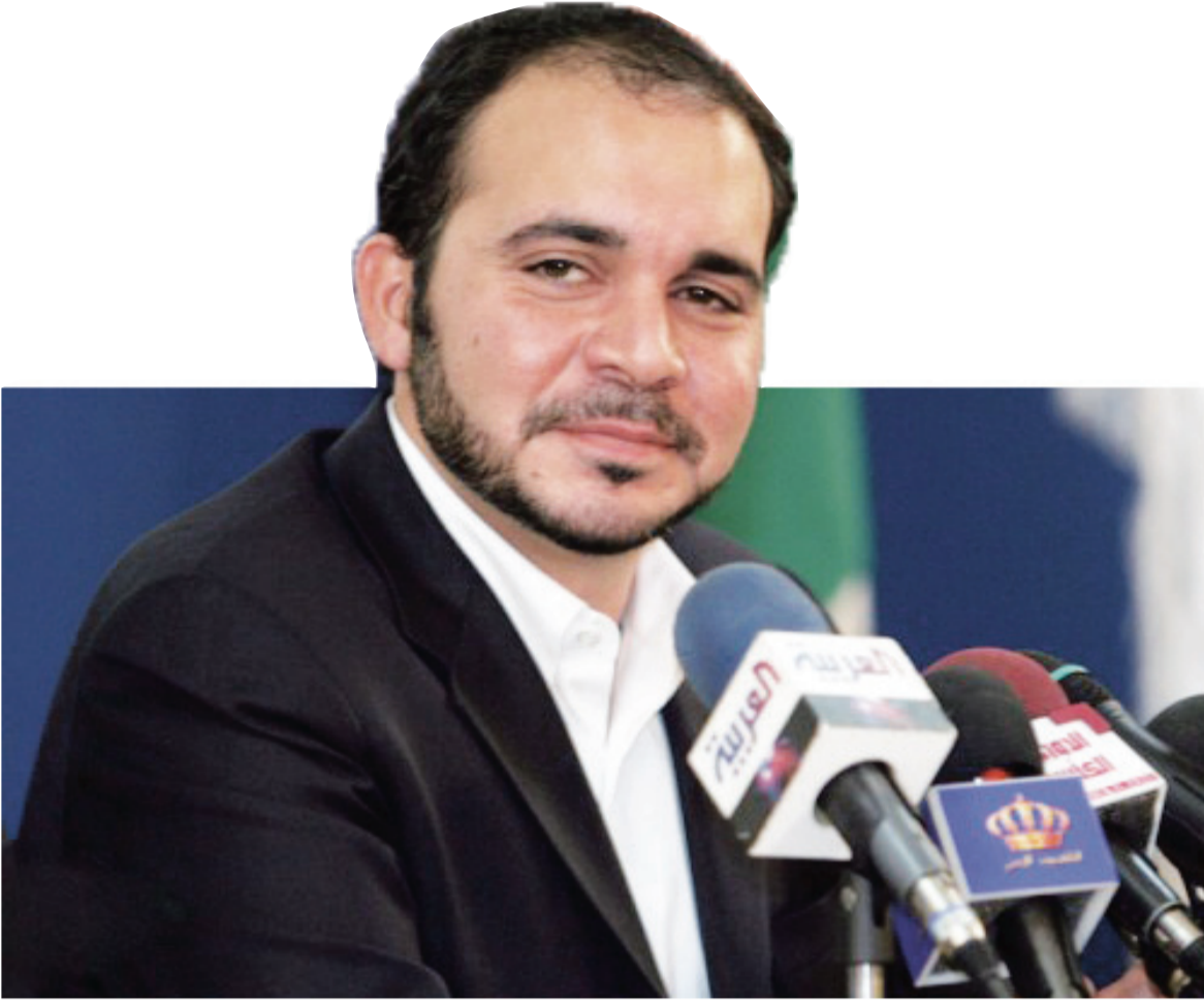
الأمير علي .. فارس تتنظرة «الفيفا»

جانب ذلك قال الملياردير الكوري الجنوبي تشونغ مونج جون المرشح المستبعد لرئاسة الاتحاد الدولي لكرة القدم أن الاتحاد الآسيوي قام بممارسة «الاحتيايل الانتخابي» من خلال دعم خصمه الفرنسي ميشيل بلاتيني وأن رئيسه البحريني الشيخ سلمان بن إبراهيم آل خليفة دعم ترشح بلاتيني علناً، رغم أنه منافس له وكان قد بعث برسائل إلى كل الاتحادات الآسيوية تقريباً، باستثناء كوريا الجنوبية والأردن، من أجل دعم بلاتيني، وحث تشونغ لجنة الانتخابات في فيفا على إجراء تحقيق فوري مع المتورطين في القضية، بينهم الشيخ سلمان وبلاتيني، واصفاً الأخير بأنه «متعجرف».