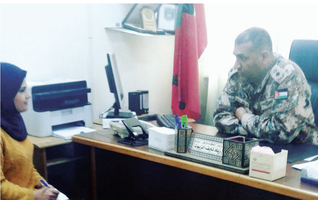
المقدم الزبوت يتحدث لـ صحافة اليرموك

للطلبة المستجدين ونماذج تأجيل الدراسة للطلبة القدامى، التنسيق مع دوائر الجامعة لتأجيل الطلاب والإبلاغ عن كل طالب يتوقف عن الدراسة، وتسهيل معاملات العسكريين الذين يدرسون بالجامعة بعد إحصارهم الموافقة الأمنية المتعلقة بدراساتهم.