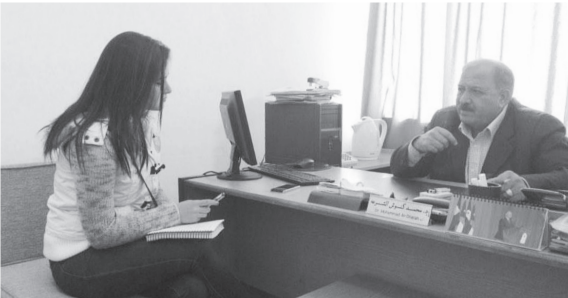
الشرعة في حوار مع الزميلة البطيئة

القفز إلى الحزبية مباشرة، فلا بد أن يكون هنالك توازن على حد قوله، نأخذ من العشائرية المزايا الجيدة، الاجتماعية و عاداتنا و تقاليدينا و قيمنا و العمل السياسي، وأن يكون هنالك نشاط مكافئ من خلال الأحزاب السياسية و العمل السياسي.