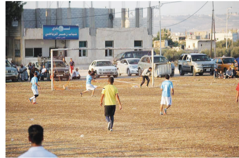
ملعب نادي زحر

وتنس واستراحة لمشاهدات المباريات الرياضية. وحول إنجازات نادي شباب زحر الذي تأسس حديثاً عام ٢٠١٢، أشار الهزايمة إلى مشاركة النادي في عدة مسابقات حصل من خلالها على المركز الأول في بطولة الريشة للدرجة الثانية، وثالث في الدرجة الأولى في لعبة القارة الآسيوية، وفي مجال ألعاب القوى حصل النادي على بطولة المملكة للرمح عبر لاعبه أحمد قواسمة، وفي سنة ٢٠١٥ حصل النادي