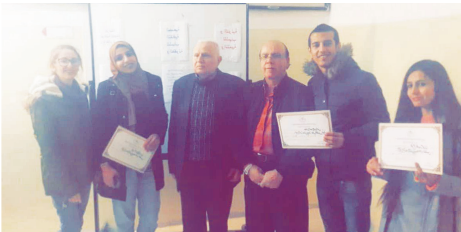
فريق صحافة اليرموك المشارك في الدورة

وبيّنت الجمال أن النفايات الصلبة المفترزة تجّمع من مناطق البلدية اربد الكبرى كافة، بواسطة الشركة المشغلة (بي إي لخدمات البيئة)، ولكن بكمية لا تتجاوز ٢٠ طناً يومياً، بما يتناسب والسعة