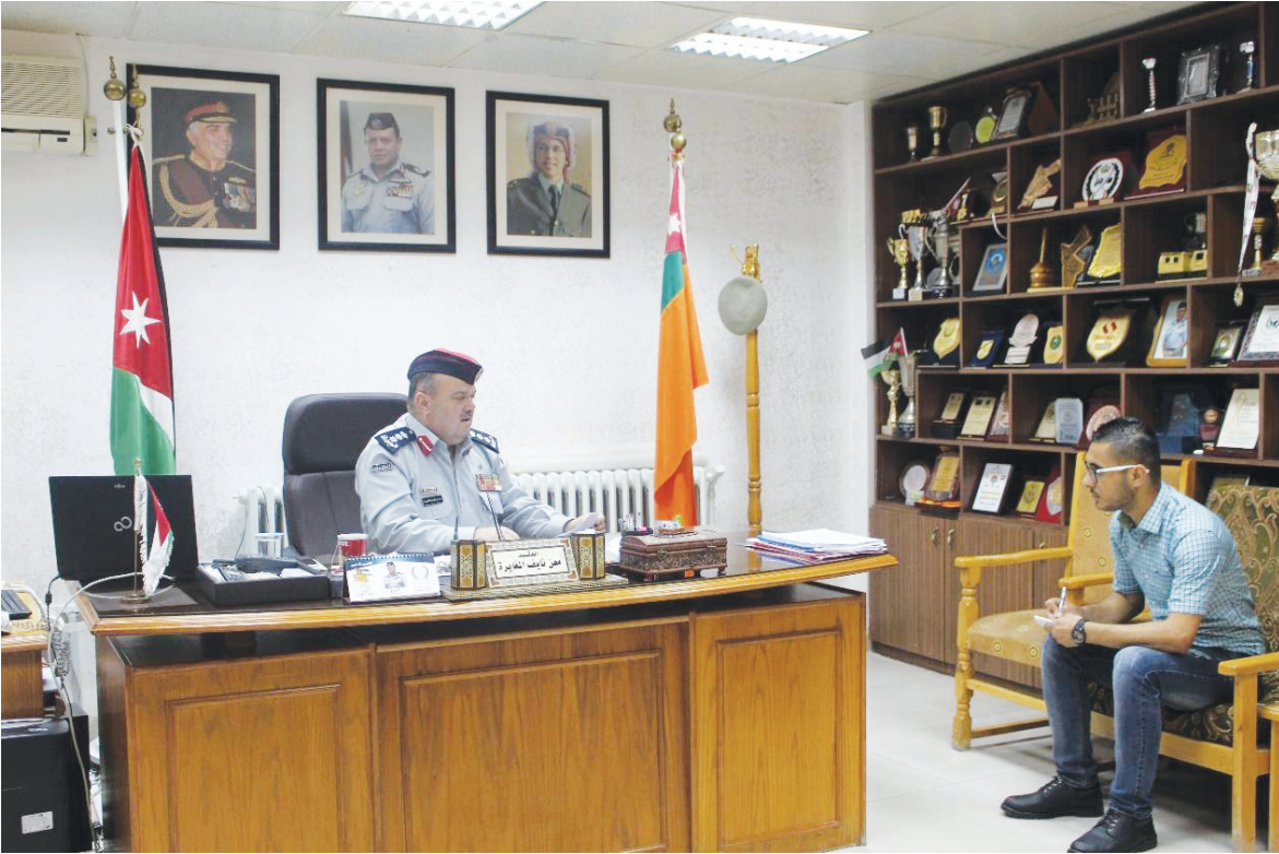
المغايرة يتحدث للزميل المغايرة

والسيطرة الموحد على الرقم ٩١١ وتمتير هذه الملحوظة إلى الأقسام والمراكز التابعة لاية مديرية من المديرية الميدانية الموجودة في المحافظات.