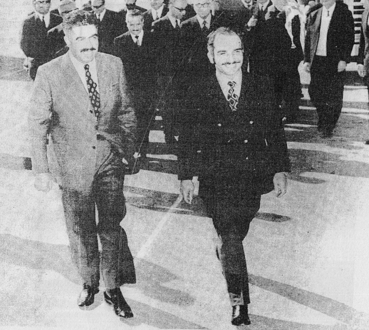
المغفور له الحسين في وداع الرئيس الشهيد وصفي التل ١١٢٦\١٩٧١١١ يوم سفره الى القاهرة