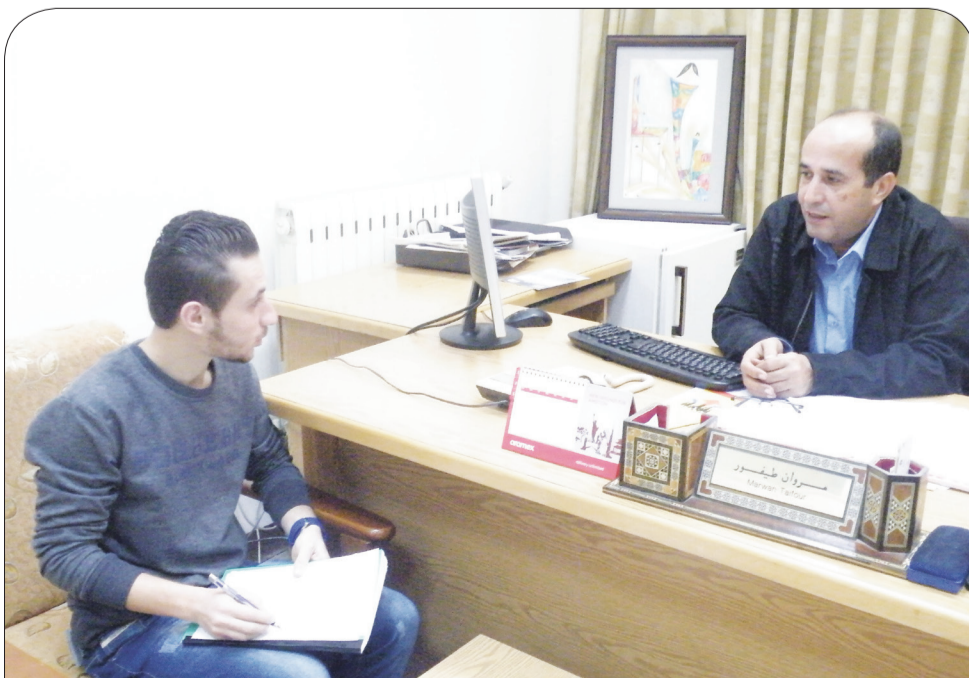
الثاني للتأهيل الوظيفي يتواصل مع العديد من المؤسسات والمعهد الوطني الديمقراطي وبرنامج التدريب الصيفي والمبادرات والجهات خارج نطاق الجامعة كمبادرة إنجاز (درب).

وأشار طيفور إلى أن مكتب صندوق الملك عبدالله