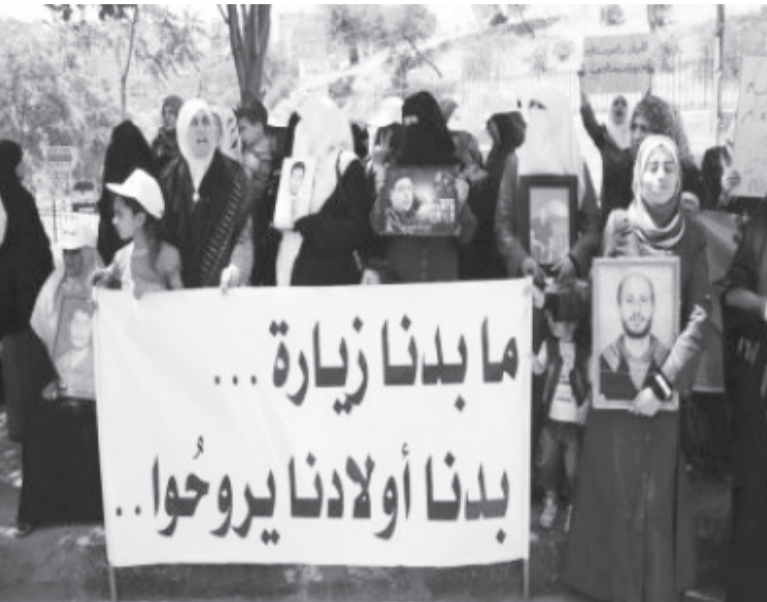
من وقفة سابقة نفذها اهالي الأسرى للمطالبة باطلاق سراح ابنائهم من السجون الاسرائيلية

أبيب تتابع أوضاع المعتقلين كافة وتعمل على نقل مطالبهم إلى السلطات الإسرائيلية المختصة، والعمل على تليبيتها وفق المعاهدات الدولية.