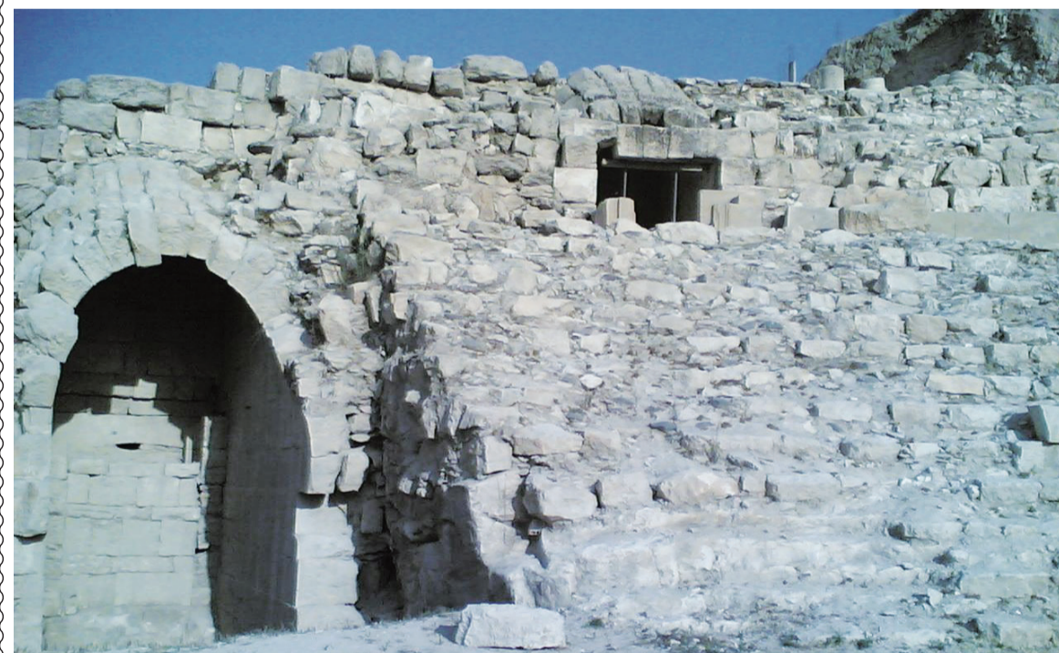
أحد المواقع الأثرية في بيت راس