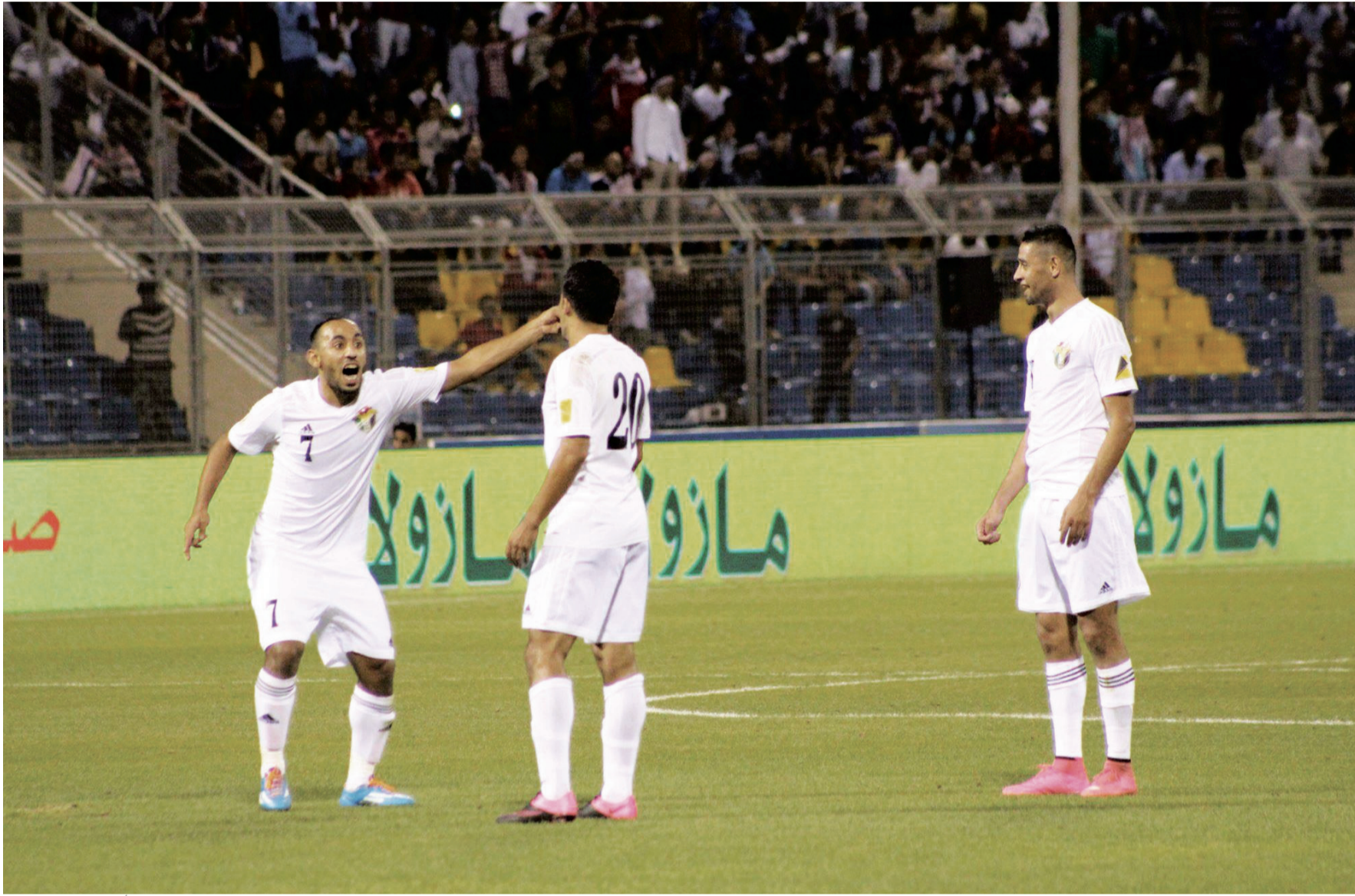
حسن .. والدردور .. و ابو عمارة .. في لحظة «عقاب كروي» ودي خلال مباراة طاجكستان الأخيرة على استاد عمان