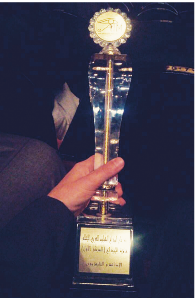
دفع المركز الأول لمهرجان إبداع الشباب العربي الإعلامي

عمر طفل لم يبلغ من العمر الخامسة عشر، يغادر منزله مع شروق الشمس ويعود في آخر الليل بينما غيره من أقرانه يذهبون لمدراسهم ويجلسون على مقاعد التعليم