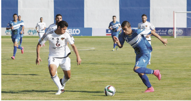
من الدوري الموسم الماضي