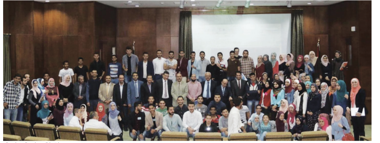
لقطة جماعية ختامية