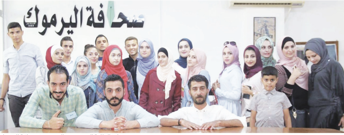
من زيارة الطلبة المستجدين الى جريدة صحافة اليرموك