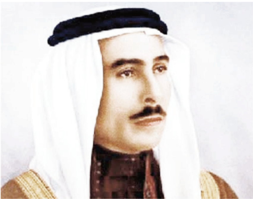
الملك طلال .. أقدم لعمدة سنتين في القصر

المرثي فلا يملك أي صورة للقصر تبين مبناه. إربد ومن سواها مكونة من مجلدات حملت تاريخ وطن عظيم سمي بالأردن وما زال العالم يشهد كل أي توثيق واهتمام من الجهات الرسمية، لكنها