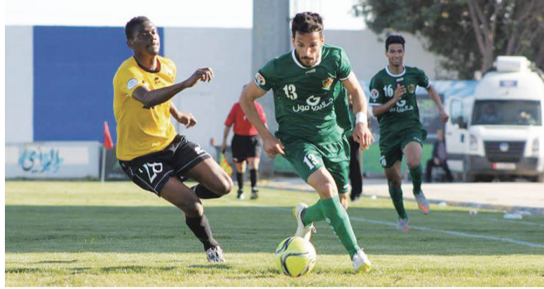
من الدوري الموسم الماضي

كلمة المستحيل ليست موجودة في قاموس فريق الحسين اربد، موعلا على عبارة «كرة تعطى من يعطيها» للمضي بالمسيرة، رغم «العقبات» وتواتر الانتكاسات إلا أن غزاة