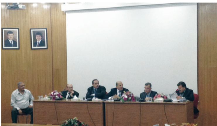
من الجلسة الحوارية