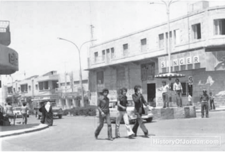
وسط مدينة إربد كما بدت في سبعينيات القرن الماضي

المشاركون في الدبكة من الشباب يهزجون بأهازيج كثيرة مثل «على دلوعة وعلى دلوعة الهو شمالي غير الوثنا»، تم تقال الاناشيد من الشعراء الشعبية بمدح العريس وفي مدح عشيرة العريس وكان من عاداتهم في ليلة الدخلة يقفون رأس العريس برأس العروس لأن هذه العادة تورت المحبة.