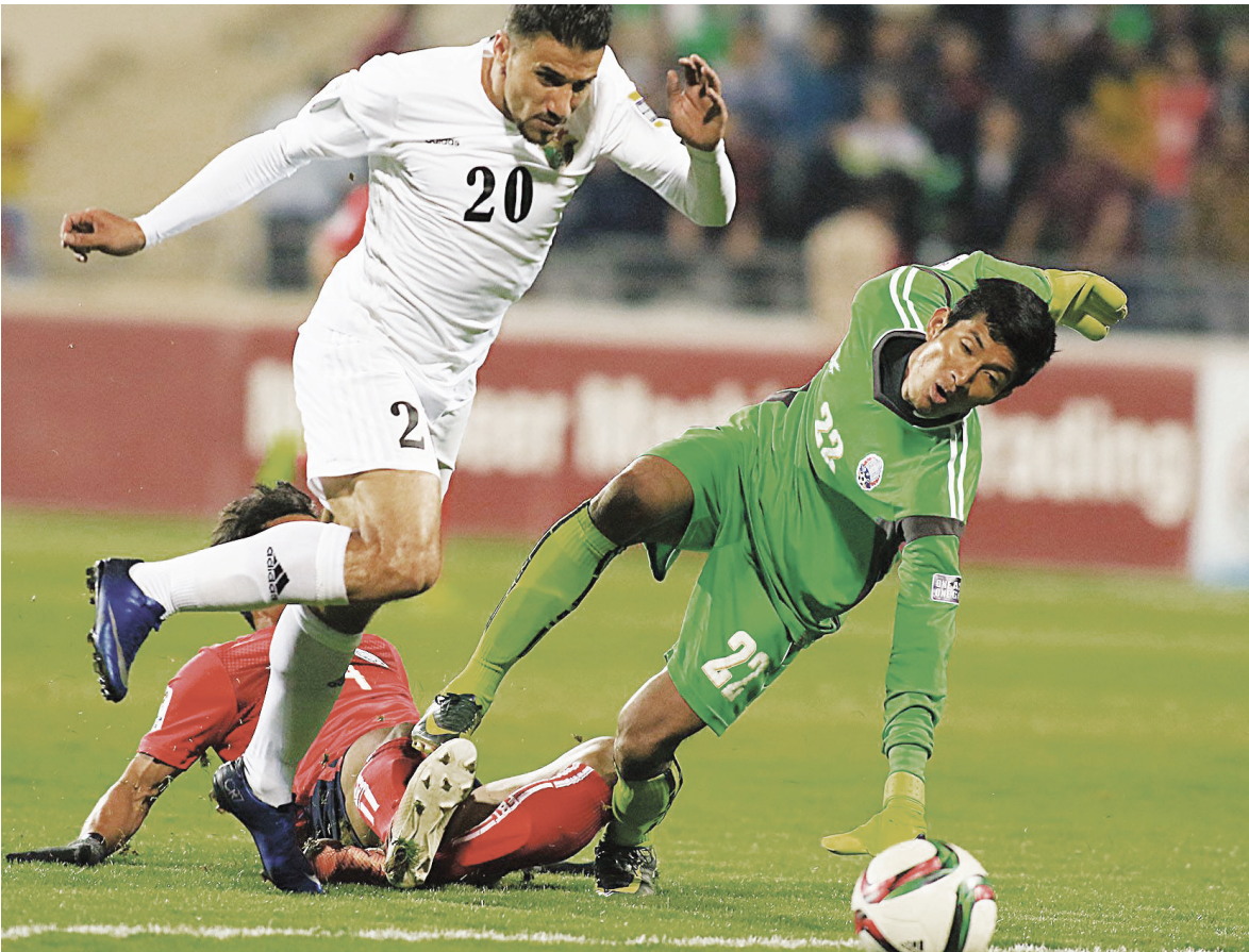
من مباراة منتخبنا امام منتخب كمبوديا