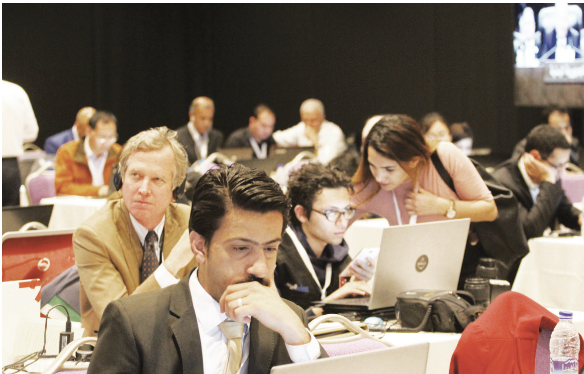
تغطية اعلامية واسعة راقتت القمة