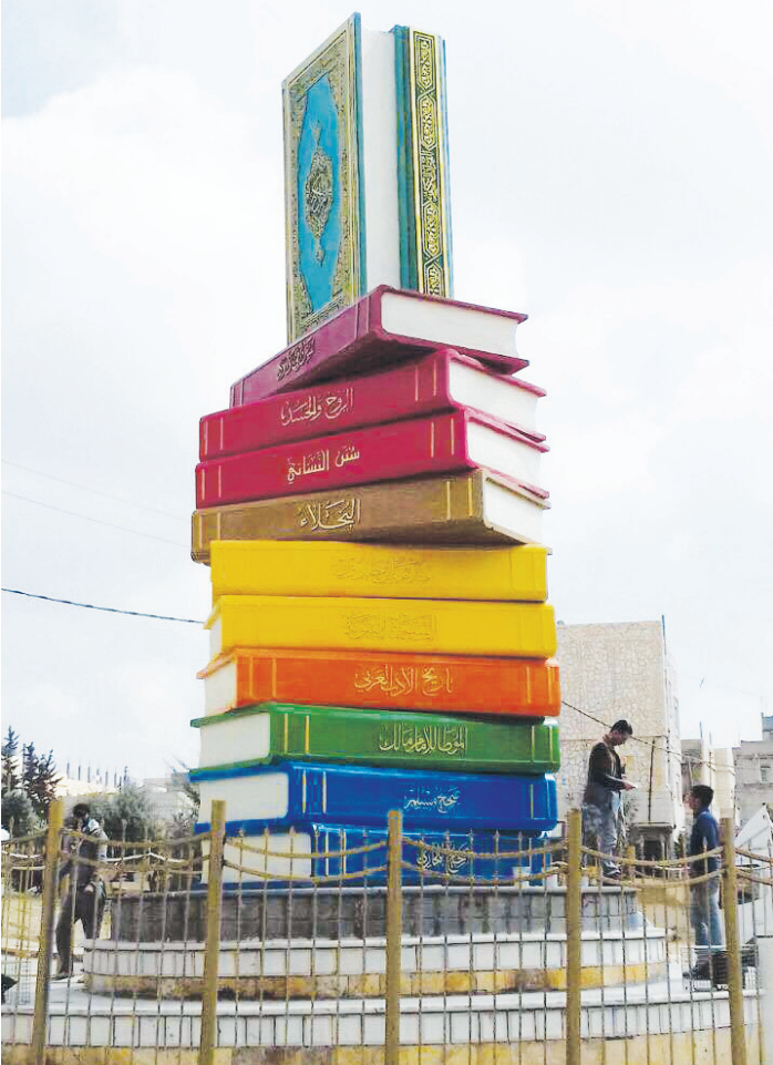
دوار إقرأ في سحاب

هذا سيأتي بعد تعب، ونحن بدأنا بعمل هذه المشاريع من الصفر، لافتاً إلى أنه تم تمويل هذه المشاريع كلها من قبل بلدية سحاب والبنك الدولي ومنح من بنك تنمية المدن والقرى.