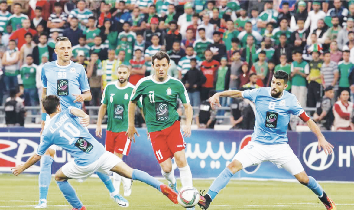
القطبان... في منافسة كروية سابقة