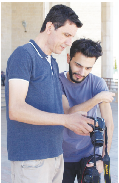
الداوود خلال التدريب