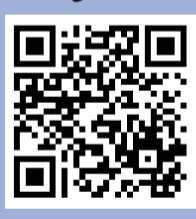
الموقع الرسمي للجريدة