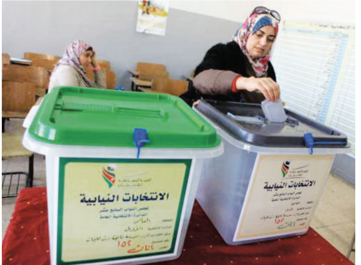
مواطنات يشاركن في الاقتراع لانتخابات سابقة