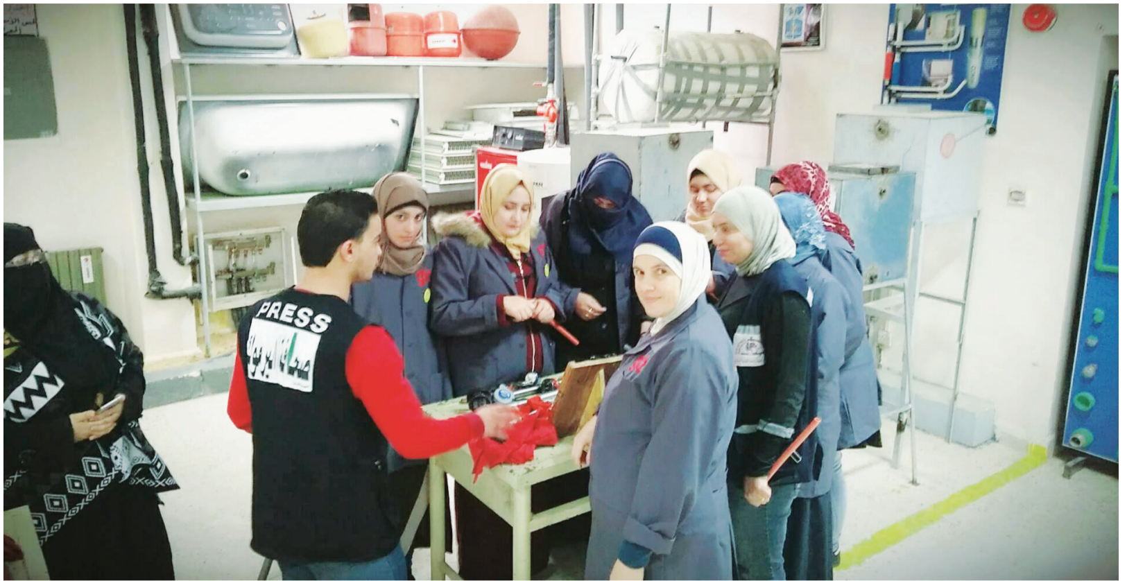
سيدات خلال دورة السباكة في مركز مهني جرش

لا أريد سوى أن أكون حرة كالطير لا تكيف مع المكان بل أهاجر للمكان الذي يتكيف معي .