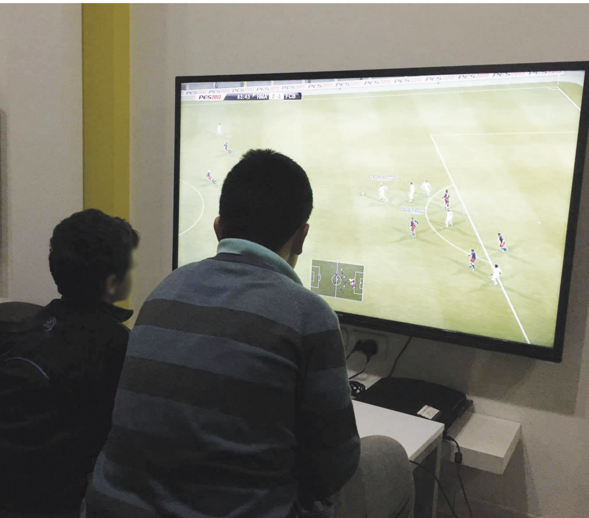
أحداث في أحد مقاهي انترنت اربد

فيما يؤكد مجموعة من الأهالي الذين لاحظوا ذهاب أبنائهم إلى هذه المقاهي ، عند سؤالهم عما إذا كانوا راضين أو غير راضين