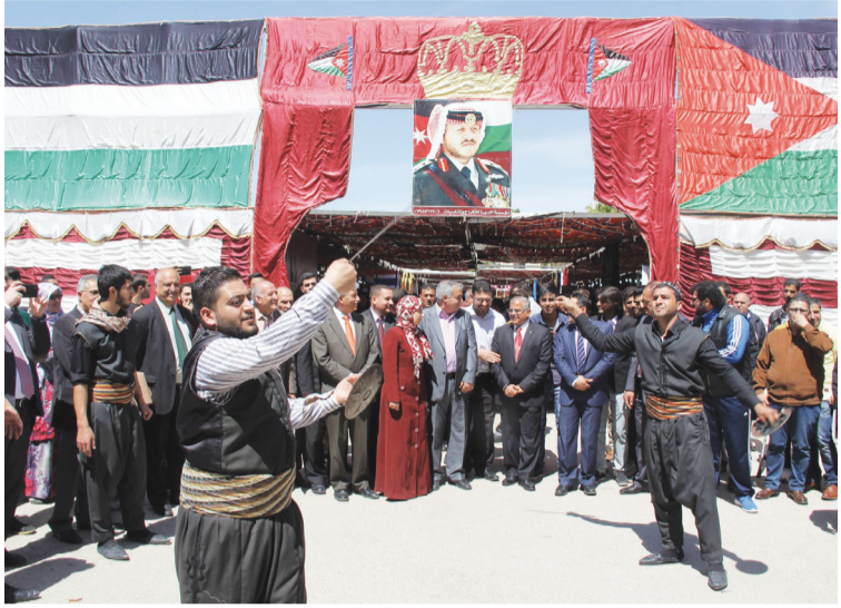
من احد نشاطات الطلبة الوافدين

وقال إن عدد الطلبة الوافدين، على مقاعد الدراسة خلال الفصل الأول من العام الجامعي ٢٠١٧-٢٠١٨، بلغ ٢٩٠٠ طالب وطلبة يمثلون أربعة وأربعين جنسية، أغلبهم في كليات الآداب والشريعة والتربية الرياضية، بالإضافة إلى أعداد منهم ممن يدرسون لمرحلة الماجستير في العديد من الكليات وخاصة الإعلام والاقتصاد والتربية، متطعين إلى زيادة هذا العدد في السنوات